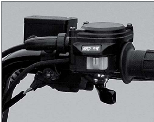
С системой DCT водитель может наслаждаться автоматическим переключением передач или переключать передачи самостоятельно, нажимая соответствующие кнопки