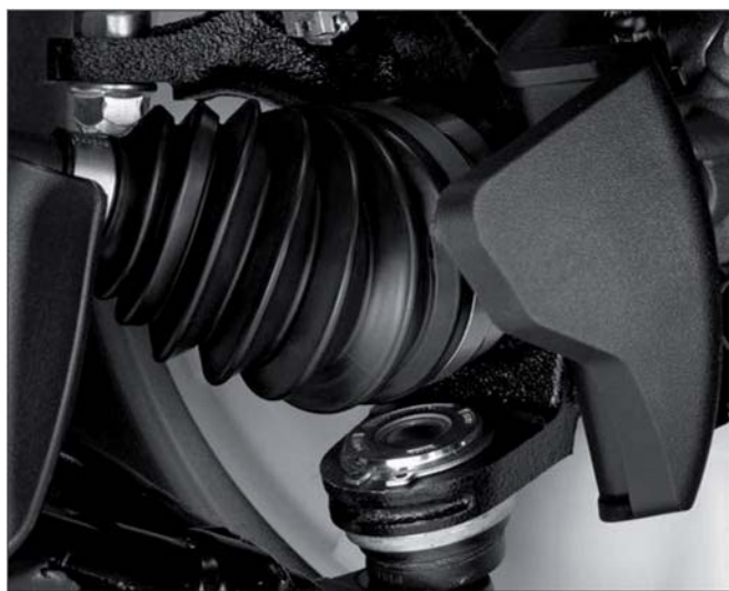
Пыльники шарниров из термопластичного эластомера (TPE) имеют более высокую стойкость к разрывам (на 65 % больше, чем у резиновых)